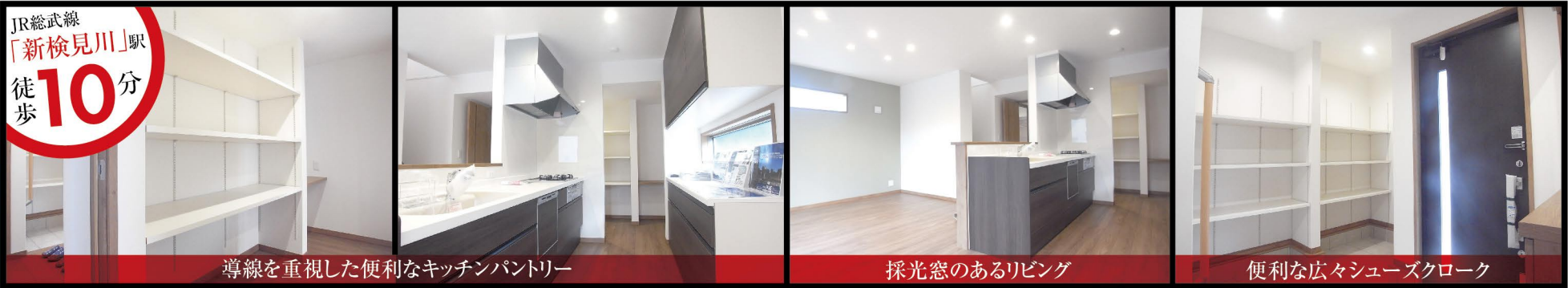
導線を重視した便利なキッチンパントリー